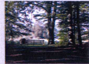
Het hek van voormalig Erve Strootman