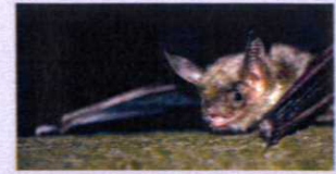
Vale vleermuis op de Lonnekerberg

Links voor u in het bos ziet u een grote muur met een uitstulping: de kogelvanger. In de uitstulping zit zand dat de kogels moest opvangen. In het verleden werd de schietbaan gebruikt om de boordkanonnen van de vliegtuigen te richten en te oefenen met schieten. We vervolgen de route met de bocht mee naar rechts.